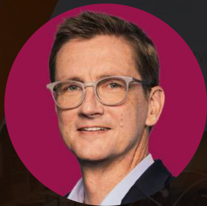
ULRICH HOFFMANN CEO, PLUSNET

Die ANGA COM ist für uns eine wichtige Plattform für den direkten Austausch mit Kommunen, Geschäftskunden und Partnern. Das persönliche Gespräch ist einfach nicht zu ersetzen – vor allem wenn es darum geht, smarte Lösungen für die digitale Zukunft Deutschlands zu diskutieren und wichtige Impulse zu bekommen.