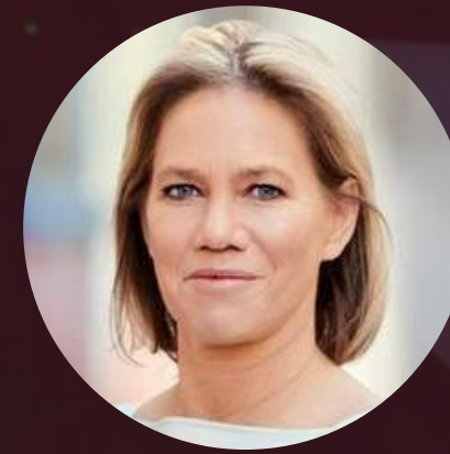
CHRISTINE STROBL PROGRAMMDIREKTORIN, ARD

Die ANGA COM war eine rundum gelungene Veranstaltung: Die persönliche Begegnung und der lebhafte Austausch mit KollegInnen aus der Medien- und Digital-Branche stand im Mittelpunkt und das ist gut so. Nur durch das Ringen um Lösungsansätze für den digitalen Wandel werden wir die Zukunft gestalten können.